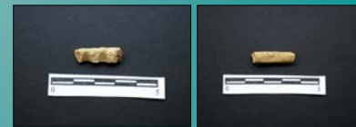
Figura nº 8: Pieza con doble perforación