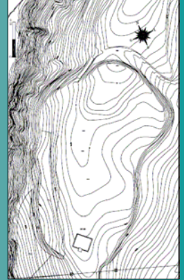
Mapa nº 3: Topografía del Castro