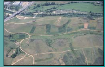
Mapa nº 2: Foto aérea del cerro