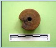
Figura nº 2: Nuez de ballesta

En cuanto a los contextos arqueológicos en los que aparecieron estos elementos, se trata en casi todos los casos de rellenos para la preparación de suelos, o bien en niveles de derrumbe de muros. En ningún caso se han podido vincular estas piezas óseas a espacios con algún tipo de función concreta de las piezas propiamente dichas.