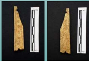
Figura nº 7: Pieza troquelada