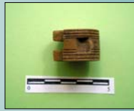
Figura nº 3: Dado